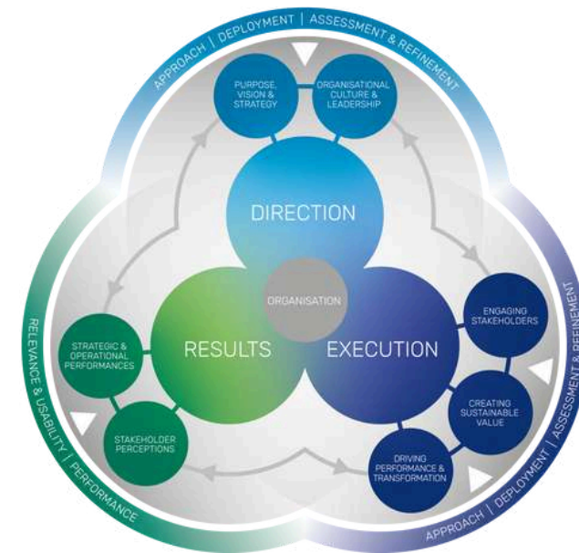
The EFQM Model

On this course, you will gain access to EFQM's online platform, AssessBase, an intuitive platform to support your organisation as it goes through the assessment process.