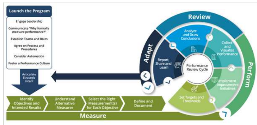
Figure 2. Measure-Perform-Review-Adapt framework